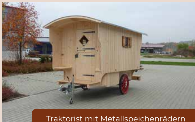
Traktorist mit Metallspeichenrädern und 25 km/h