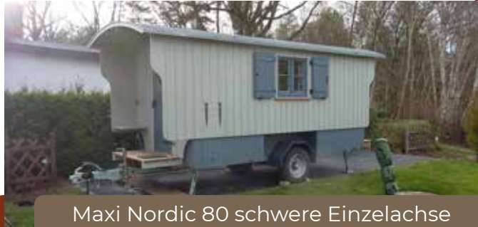
Maxi Nordic 80 schwere Einzelachse 3500 kg zul. GG