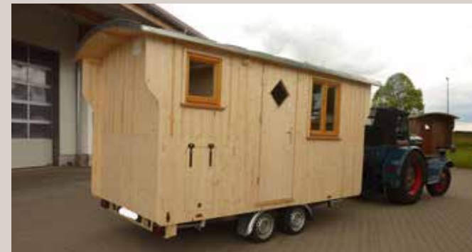
Reisewagen 190 x 400 cm innen mit Dusche, WC, fließend Warmwasser an drei Stationen, autarke Strom- und Wasserversorgung

Unsere Reisewägen basieren auf einer geraden durchgehenden Holzkonstruktion im Boden. Dies ermöglicht eine völlig freie Innenraumgestaltung. Auch die Platzierung der Fenster und Türen ist frei wählbar. Mit 10 cm Holzwolle Dämmung im Boden bleiben die Füße stets warm.