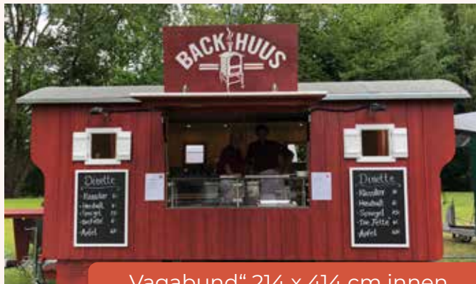
„Vagabund“ 214 x 414 cm innen

Unsere Verkaufsschäferwägen „Vagabund“ bekommen Sie 2,14 x 3,5 bis 5,5 m. Den kleinen „Streuner“ fertigen wir 1,9 x 2,2 bis 2,0 x 3,5 m Innenmaß.