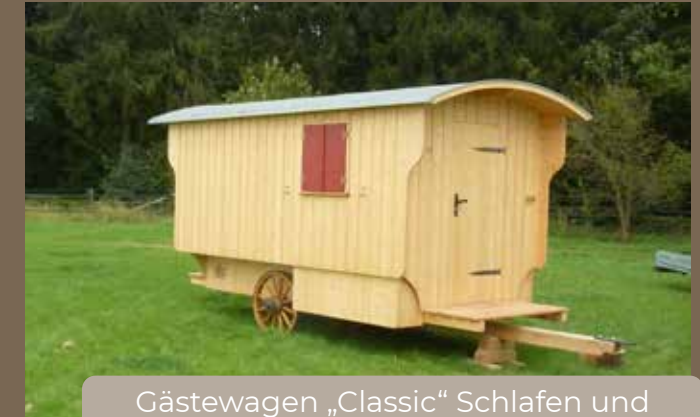
Gästewagen „Classic“ Schlafen und Aufenthalt für 3-4 Personen