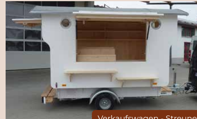
Verkaufswagen - Streuner