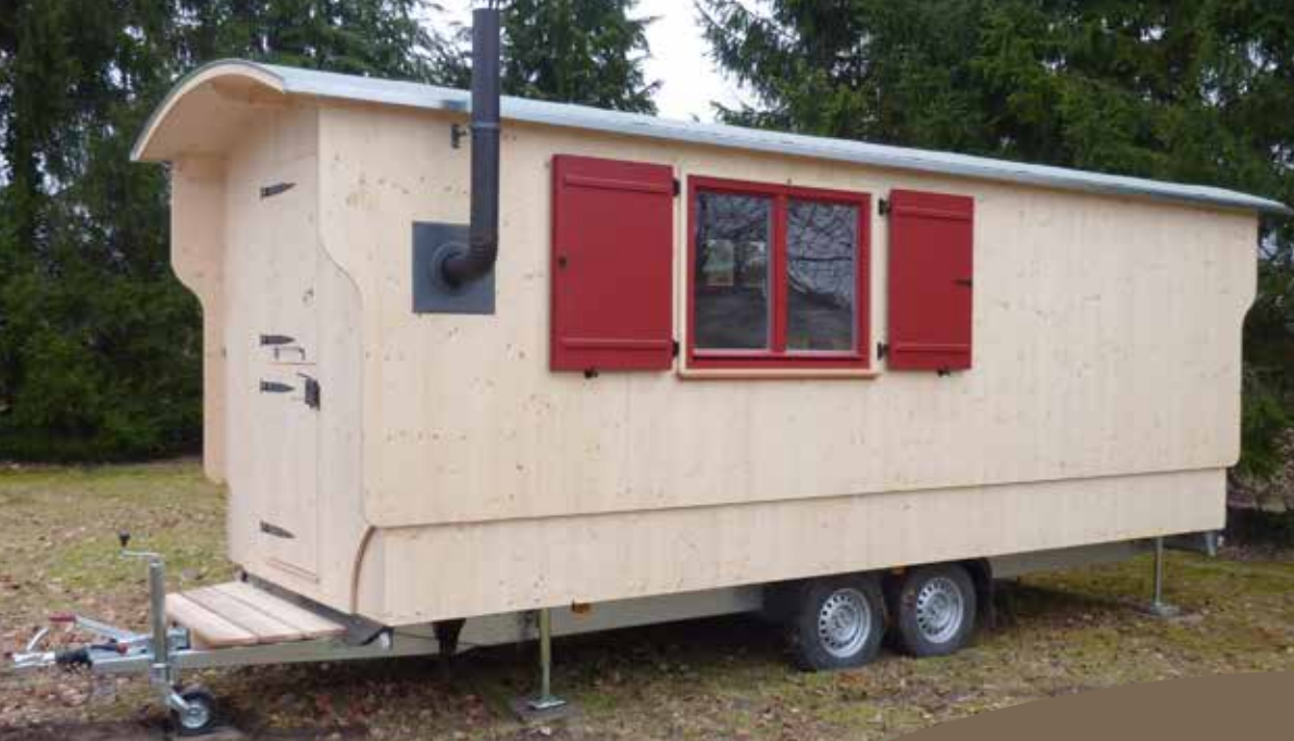
Reisewagen 6.3 Tandemfahrwerk 3500 kg zul. GG Größe 206 x 626 cm innen