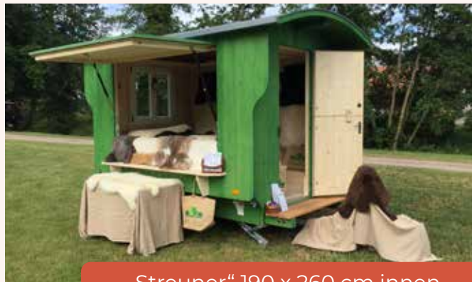
„Streuner“ 190 x 260 cm innen