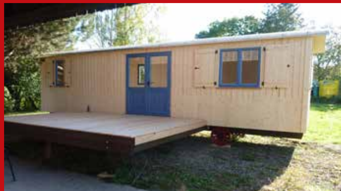
stationärer Zirkuswagen zum dauerhaften Wohnen Größe innen 2,5 x 10,0 m