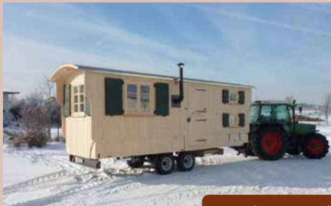
Jagdwagen „Enzian“ Größe 206 x 620 cm innen, 6t Traktorfahrwerk bis 25 km/h Gemütlicher Landhausstil für gesellige Runden