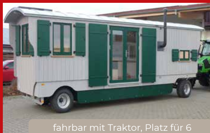
fahrbar mit Traktor, Platz für 6 Personen - Innengröße 2,20 x 7,90 m