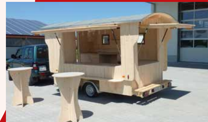
„Streuner“ 200 x 350 cm individuelle Gläserhalterungen

Weitere Innenausbauten Ihrem Verkaufsspektrums entsprechend sind individuell möglich.