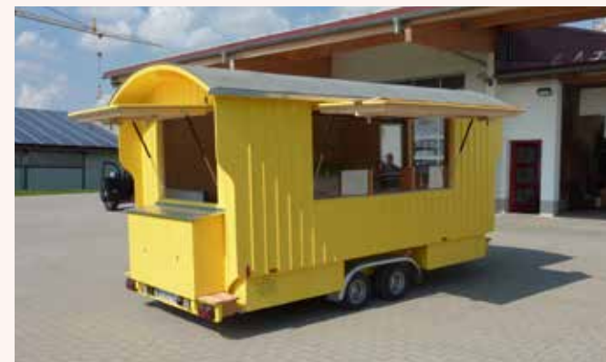
Vagabund 214 x 424 cm mit Technikkoffer, extra kleine Räder 10 Zoll 3000 kg zul. GG.