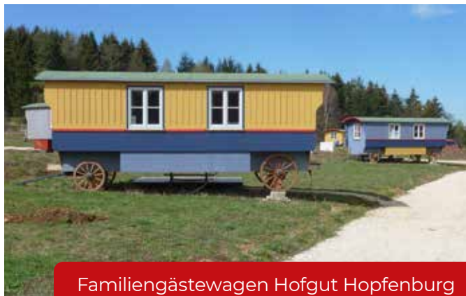
Familiengästewagen Hofgut Hopfenburg 07381/931193-11 www.hofgut-hopfenburg.de