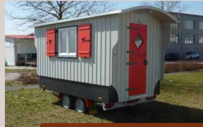
Reisewagen 3.3 206 x 326 cm innen