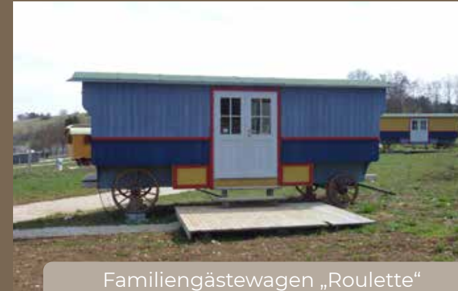
Familiengästewagen „Roulette“ 2 Schlafkojen, Küche und Sitzgruppe