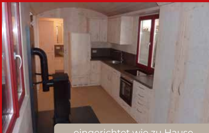
eingrichtet wie zu Hause

In besonderen Fällen sind auch Innenbreiten von 3,50 m möglich.