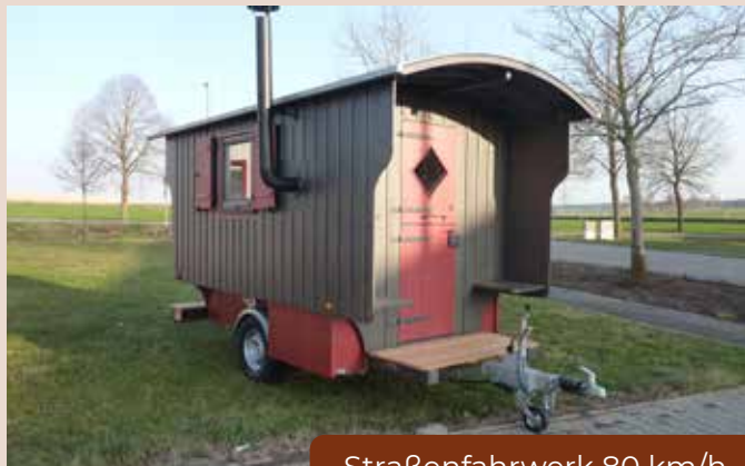
Straßenfahrwerk 80 km/h