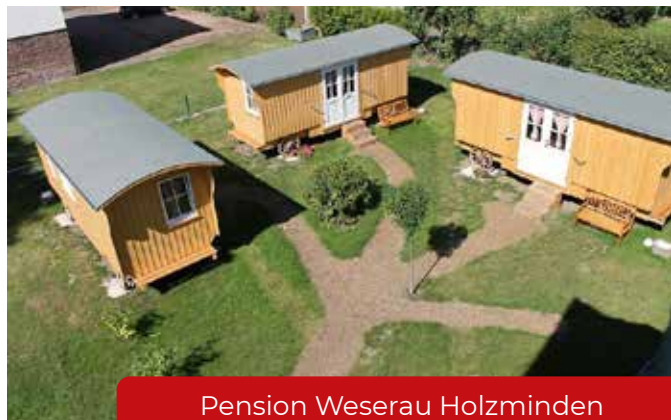
Pension Weserau Holzminden Thomas Brill www.pension-weseraue.de