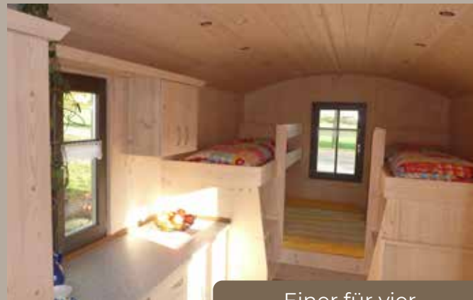
Einer für vier