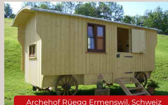
Archehof Rüegg Ermenswil, Schweiz www.rueegg4you.ch

Die aufgezeigten Anbieter freuen sich auf Ihren Besuch!