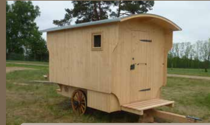
Schlafwagen „Basic“ für 4 Personen