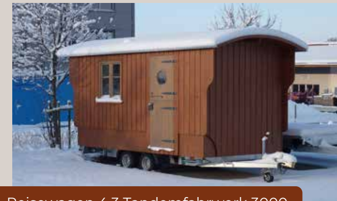
Reisewagen 4.3 Tandemfahrwerk 3000 kg zul. GG Größe 206 x 426 cm innen

Größen: Die Standardinnenbreite beträgt 206 cm – weiter sind auch 220 cm möglich. Dank der Eigenfertigung der Bodengruppe sind die Längenmaße von 300 - 600 cm innen frei wählbar.