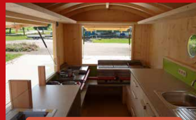
abgestufte Arbeitshöhen für ergonomische Arbeitshaltung