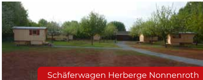
Schäferwagen Herberge Nonnenroth www.schaeferwagen-nonnenroth.de