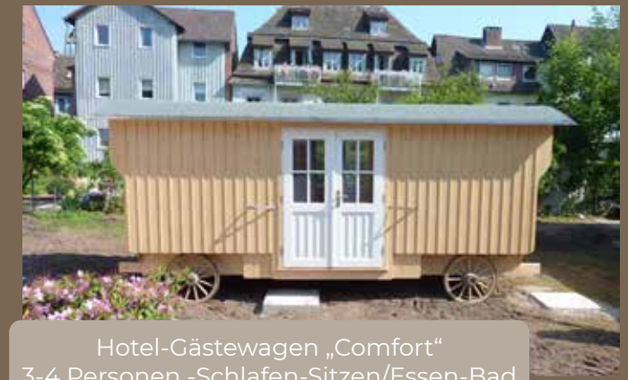
Hotel-Gästewagen „Comfort“ 3-4 Personen -Schlafen-Sitzen/Essen-Bad mit Dusche, WC und Handwaschbecken