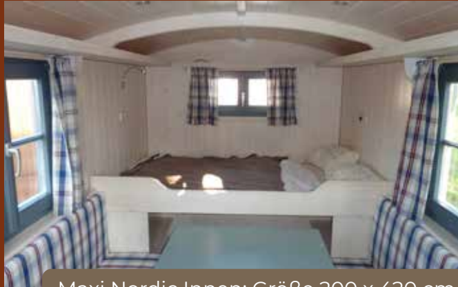
Maxi Nordic Innen: Größe 200 x 420 cm